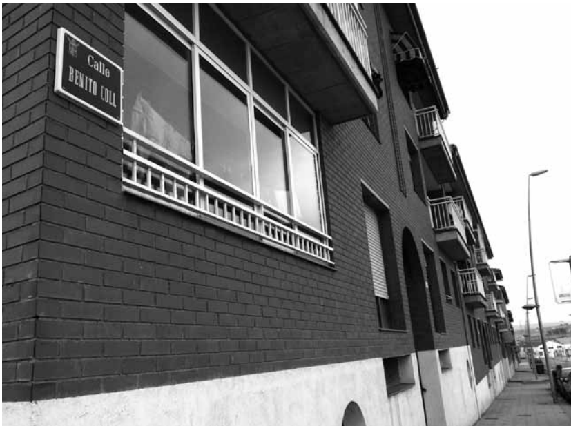
FIGURA 8: Calle Benito Coll una amplia y moderna avenida de Binéfar

Debemos analizar la vida y la obra de D. Benito Coll desde la perspectiva de los años que le tocó vivir. No podemos examinarlo, más de cien años después, con los valores y progresos políticos y sociales de nuestros días. En el final del siglo XIX y principio del XX, al mismo tiempo que las Cortes deliberaban sobre la urgencia de las conquistas liberales, la sociedad estaba entregada al despotismo y antojo de los tiranos lugareños, ya que por debajo de la teórica institución del Estado, el horizonte real de los españoles no iba más allá de su propia región, provincia o pueblo. Y fue en el ámbito local donde cómodamente se instalaron.