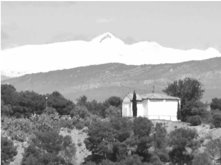
FIGURA 6: Ermita de San Quílez con el macizo de Cotiella, en el Pirineo, al fondo