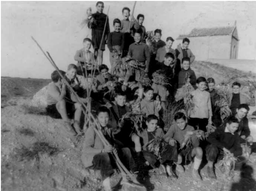
FIGURA 5: alumnos de las Escuelas, en 1955, dispuestos a plantar árboles en la Sierra

Al regreso de Huesca, convoca al Consistorio y vecindario. Presenta un borrador en el que manifiesta el paso que ha dado y trasmite su intención de ceder el terreno comprado con el exclusivo fin de repoblarlo de leñas, cediendo respetuosamente la administración y usufructo al Ayuntamiento, pero no la propiedad nominal, para que: "jamás el Estado ni nadie pudiera incautarse de nuevo de 'La Sierra'" . Esta afirmación hace intuir que "La Sierra" pudiera haber sido confiscada por el Estado, quizá como una consecuencia de la Desamortización de Mendizábal en 1836, que pasó las propiedades improductivas y en poder de la Iglesia y las órdenes religiosas no a manos del pueblo, como podría creerse que era la intención del Gobierno, sino a las manos de la oligarquía terrateniente, con lo que se impidió la formación de una clase media o burguesía que realmente hubiera enriquecido al país y acabado con la ocupación