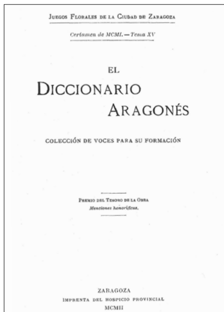
FIGURA 3: Portada del Diccionario Aragonés: Colección de voces para su formación

"De poco serviría al hombre tener una inteligencia poderosa y una voluntad firme, si estuviera privado del don inestimable de poder comunicar sus maravillosos pensamientos y caras afecciones a sus semejantes. [...] Sin el lenguaje sería imposible la vida social y los conocimientos adquiridos por la humanidad tendrían límites tan reducidos que no alcanzarían más allá de lo que permitieran nuestros sentidos corporales". Explica que participa "sólo por el amor que guardo por todas las cosas de mi tierra y el afán de aportar algunas voces nuevas al DICCIONARIO ARAGONÉS . Mi propósito ha sido coleccionar únicamente