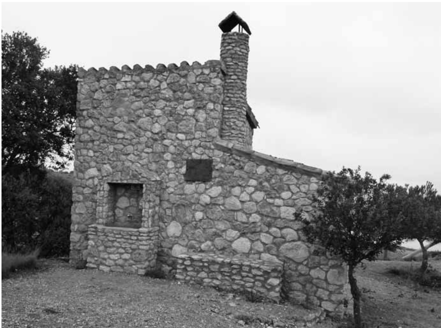
FIGURA 7: Vista del refugio Benito Coll en la Sierra

D. Benito Coll y Altabás amó profundamente a su pueblo y a sus gentes. Trabajó por el bienestar de sus conciudadanos y por el progreso de toda la comarca. En su ejercicio de abogado es notorio que nunca rechazaba un caso, aunque el vecino no pudiera pagarle.