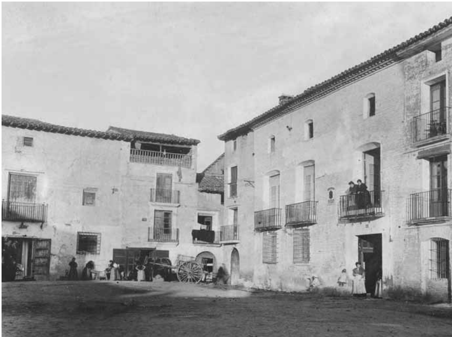
FIGURA 2: Casa natal de D. Benito en la plaza Ruata, hoy plaza de La Litera

D. Marcelino conoce la obra de Coll Colección de voces usadas en La Litera y le escribe en varias ocasiones para que este le facilite datos sobre el habla altoaragonesa, muy útiles para completar de este modo su Historia general del idioma español . Las dos